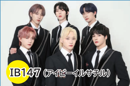
IB147 (アイビーイルガチル)

新大久保を中心に日々公演に励んでおり、正式デビューを目指して活動しています。IBとは、Idolの「I」とBoysの「B」を組み合わせたもので、147は「i will fulfill (夢を叶える)」の文字数に由来しています。