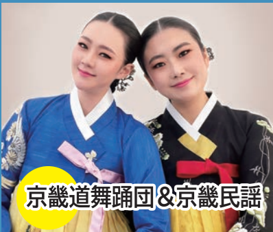
京畿道舞踊団&京畿民謡

所属メンバー400名を超える、日本を代表するKPOP歌手養成所。25社以上の韓国の事務所と提携。練習生になり韓国に渡ったメンバーは50名以上になります。