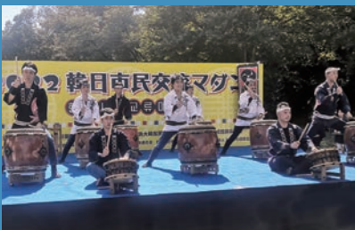
NPO 法人 横浜都筑太鼓

神奈川県と友好提携を結ぶ韓国京畿道から、農楽・サムルノリチームと民謡歌手が特別に来日！長い歴史を持つ伝統芸術を体感してください！